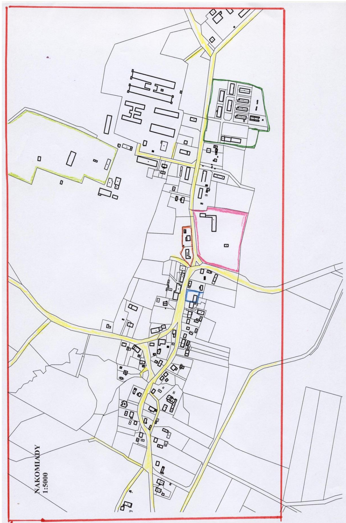
Mapa nr 2 – obszar o szczególnym znaczeniu