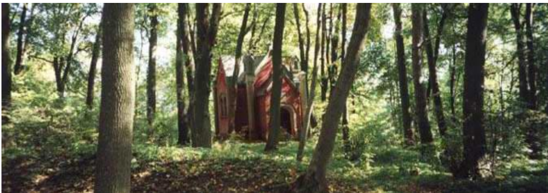
Zdj. Widok kaplicy