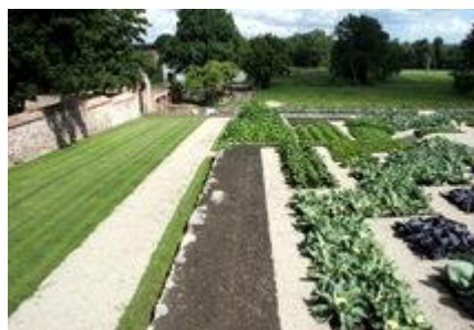
Zdj. Ogród w Nakomiadach ( przy pałacu)