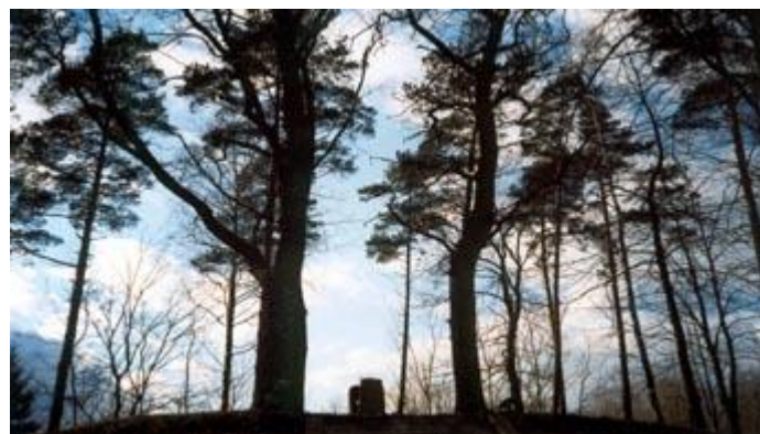
Zdj. Cmentarz rodowy rodziny von Redecker