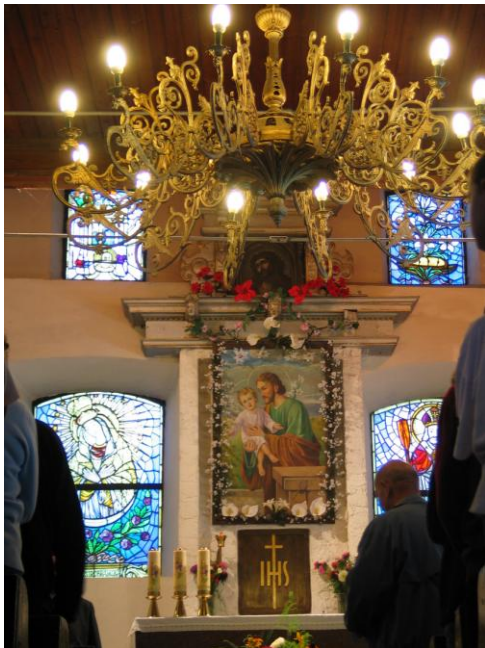
Zdj.: Wnętrze Kościoła w Nakomiadach