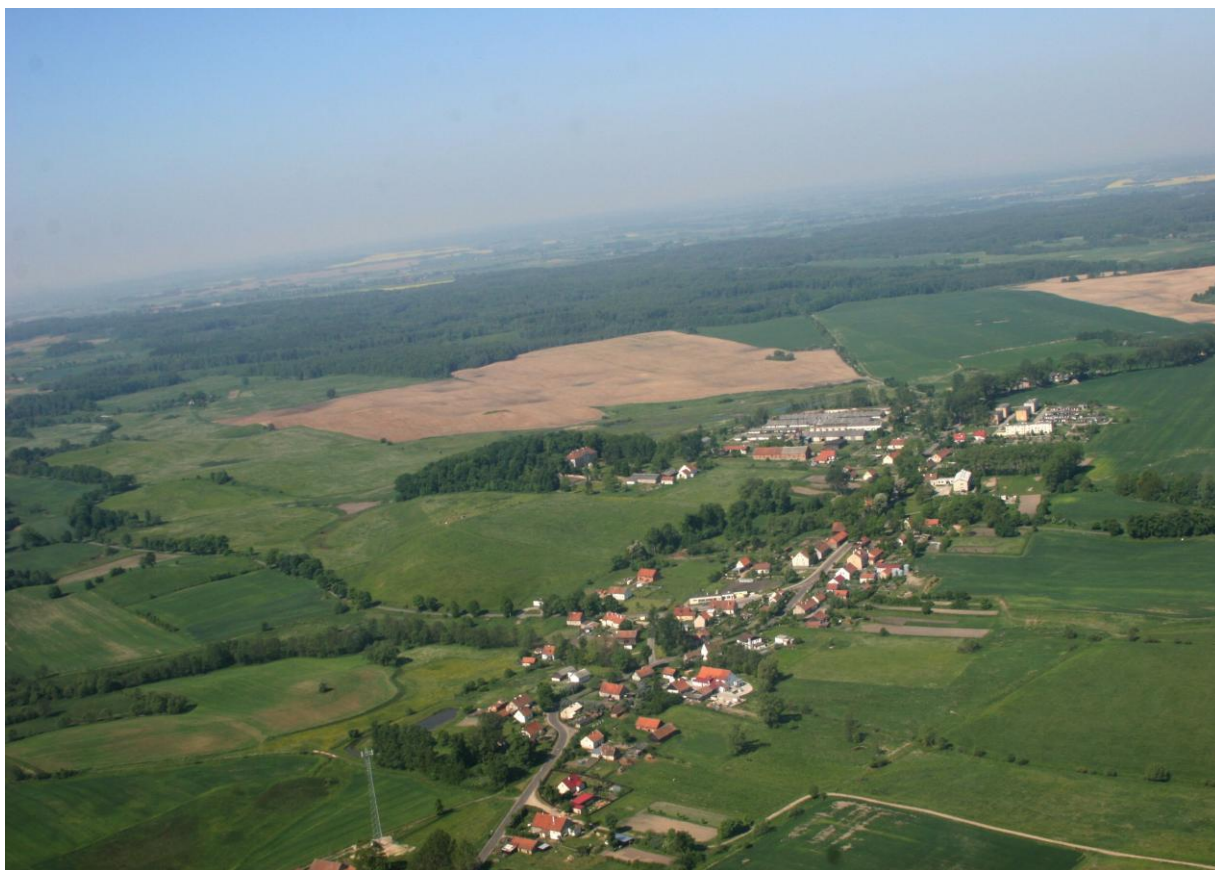
Zdjęcie: Widok miejscowości Nakomiady z lotu ptaka.