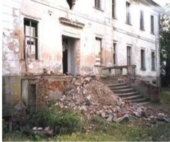
front pałacu - fot. 1998 r.