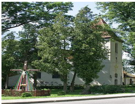
Zdjęcie: widok kościoła w Nakomiadach

Od 1978 r. kościół użytkują katolicy. Świątynia otrzymała nowego patrona – św. Józefa.