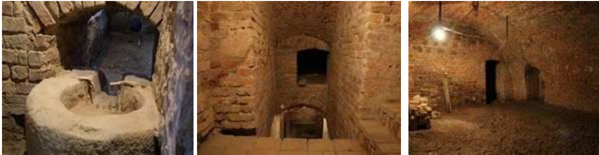
zdjęcia : widok wnętrza piwnic

Pałac ma też grono własnych duchów i zjaw. Od Krzyżaka chodzącego nocą po schodach na poddasze z psem bez głowy, innego Krzyżaka, którego oblicze można zobaczyć w studni stojącej przy dębie, po czarną damę spacerującą nocą po hall-u wejściowym i wreszcie czarną karoce zaprzęzoną w cztery kare konie bez woźnicy na koźle podjeżdżającą nocą na podjazd.