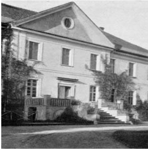
front pałacu - fot. 1930 r.