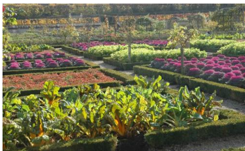
Zdj. Ogród we Francji