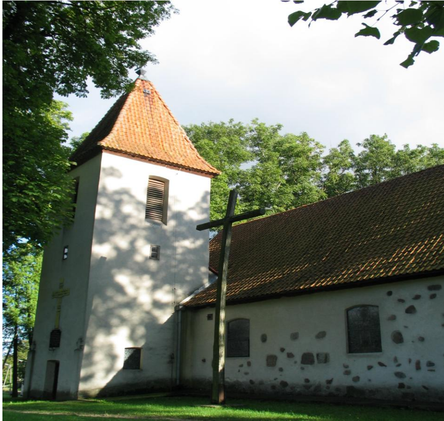
Zdjęcie : Kościół w Nakomiadach