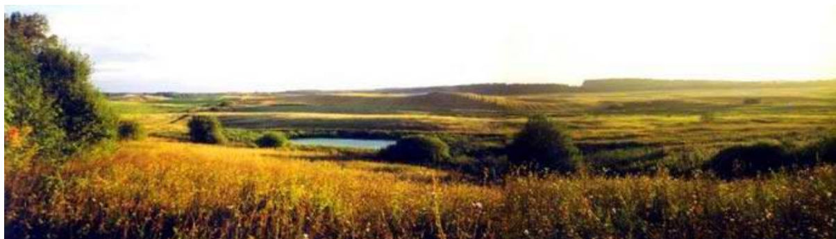
Zdj. Okolice Nakomiad