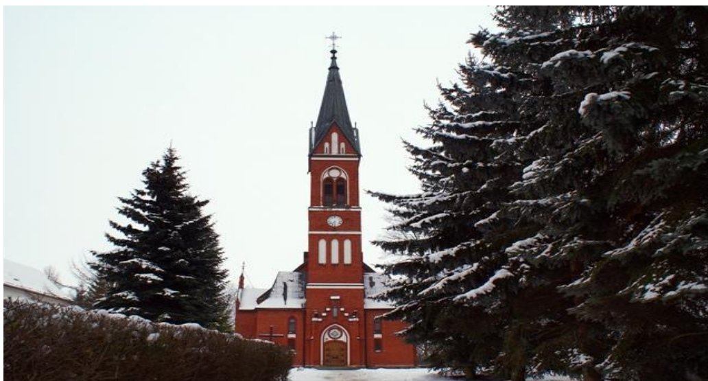
Zdjęcie: Kościół p.w. św. Stanisława Kostki w Karolewie