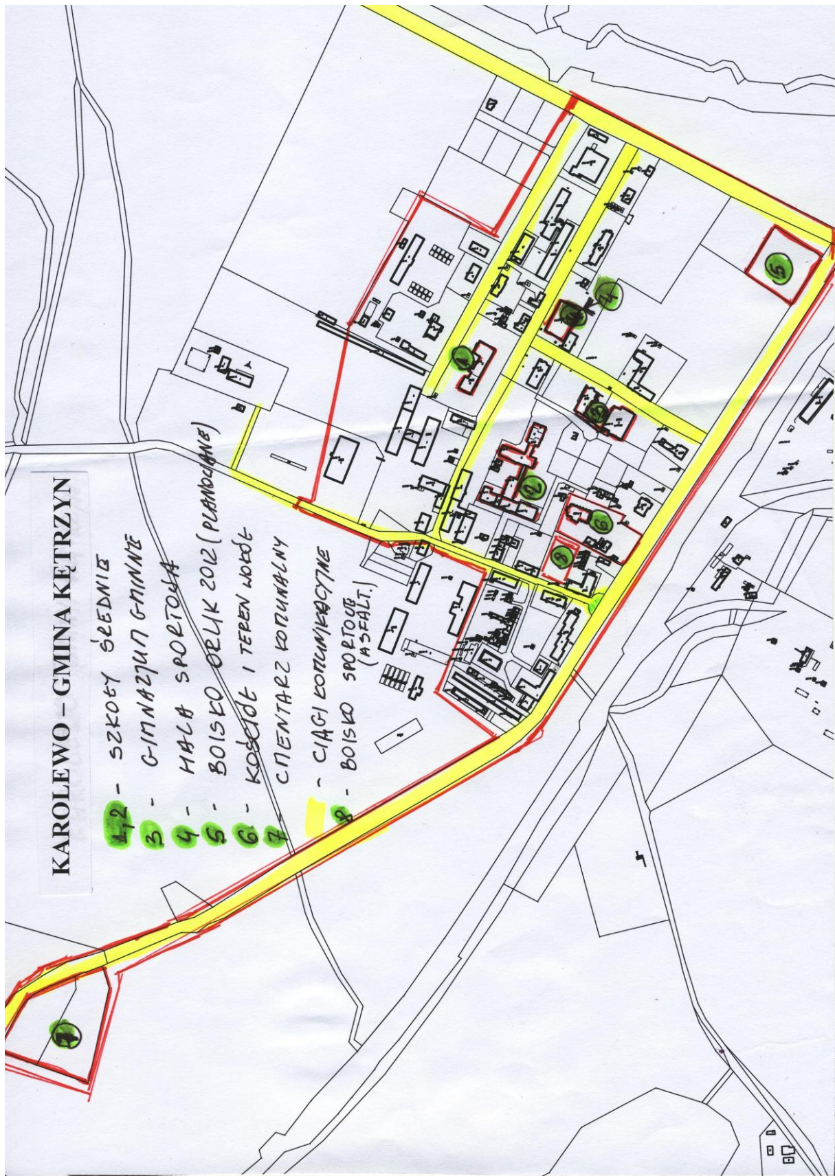
Obszar o szczególnym znaczeniu – wieś Karolewo