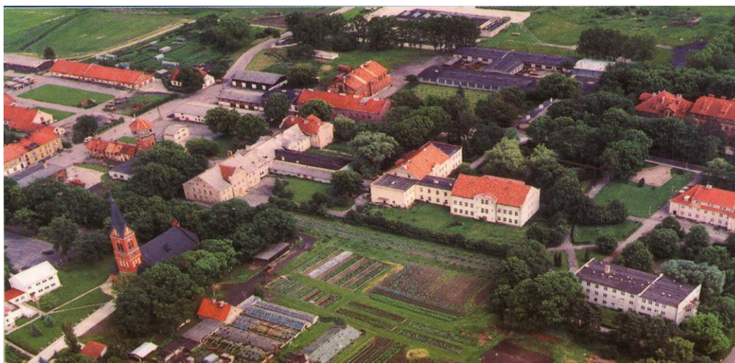
Zdjęcie: Widok miejscowości Karolewo z lotu ptaka.