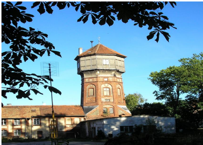
Zdjęcie: Wieża Ciśnień w Karolewie.