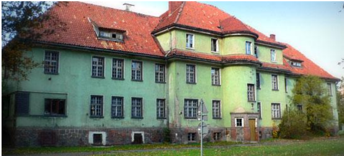
Zdjęcie: Budynek dawnego internatu „Kościuszkowiec” - obecnie własność Stowarzyszenia „Niebieski Parasol”