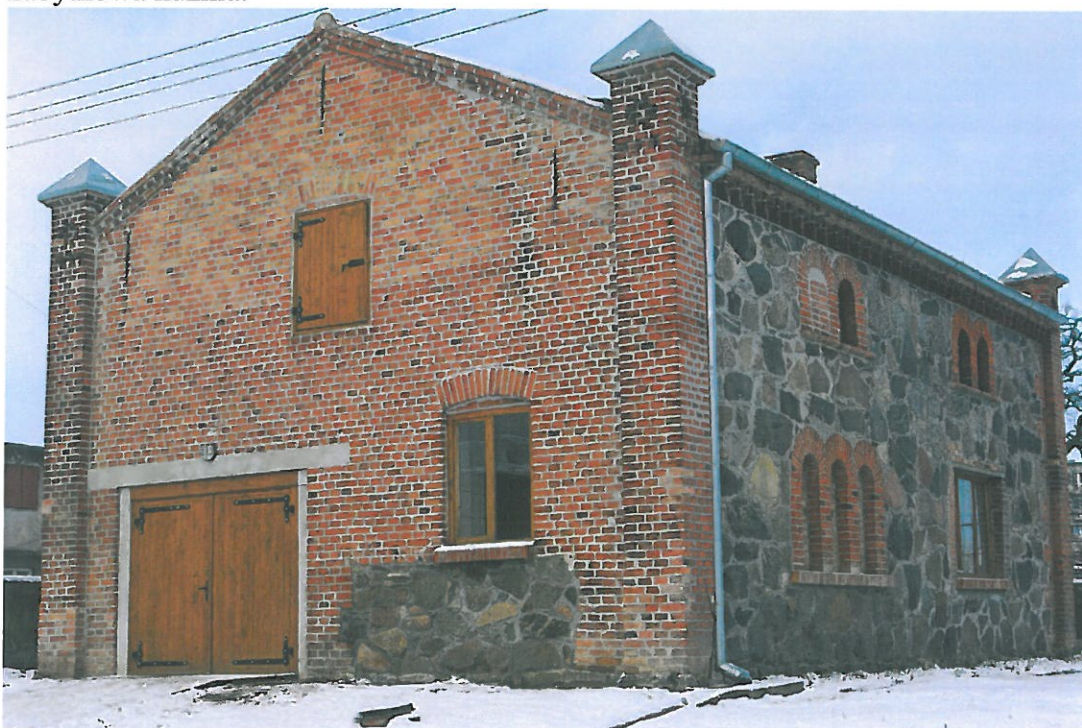
Świątlica wiejska „Kuźnia”.

Neogotycka, murowana kapliczka grobowa tego rodzaju zbudowana w XIX wieku zachowała się na starym cmentarzu opodal drogi do Karolewa. Przetrwiał też murowany dwór z drugiej połowy XVII wieku, przebudowany w XIX stuleciu. W 1848 roku odbudowano nowe skrzydło. We wnętrzu znajduje się stylowy XIX- wieczny kominek z szarego marmuru. Murowaną bramę wjazdową zbudowano również w XVII wieku. Dwór otacza park krajobrazowy w stylu angielskim, ze starym mieszanym drzewostanem, założony w XIX wieku. Nieopodal dworu znajduje się piękna, zabytkowa kuźnia.