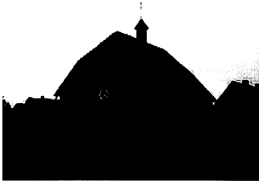
Fot. Kaplica pw. bł Franciszki Siedliskiej w Nowej Różance