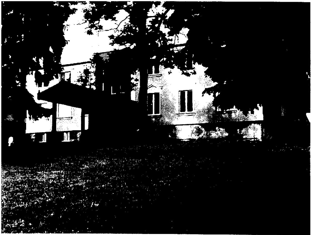
fot. Pałac w Wajsznorach

W promieniu od kilku do kilkunastu kilometrów porozrzucone są obiekty z różnych okresów historii. ( muzeum Wsi Mazurskiej w Owczarni, „ Wilczy Szaniec” w Gierłoży, gotycki kościół św. Jerzego w Kętrzynie ze sklepieniem kryształowym, barokowy kościół w Świętej Lipce ,zamki krzyżackie w Kętrzynie Reszlu, Rynie, Barcianach...)