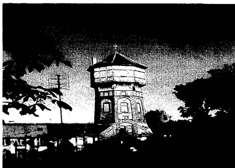
Zdjęcie: Wieża Ciśnień w Karolewie.