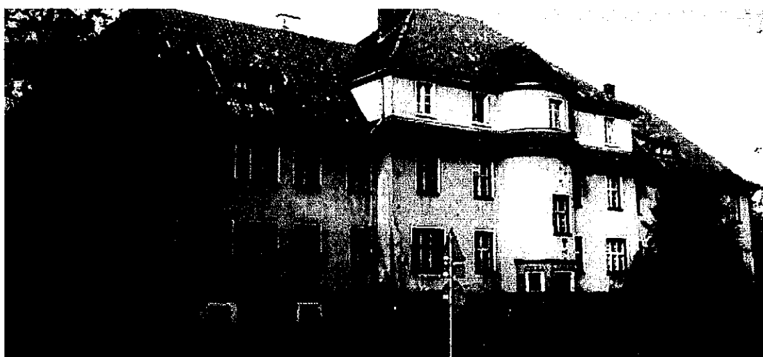
Zdjęcie: Budynek dawnego internatu „Kościuszkowiec” - obecnie własność Stowarzyszenia „Niebieski Parasol”

Stowarzyszenie na Rzecz Chorych Długotrwałe Unieruchomionych „Niebieski Parasol” z siedzibą w Olsztynie zakupiło od Starostwa w Kętrzynie budynek położony na obrzeżu Zespołu Szkół znajdującego się w miejscowości Karolewo. Usytuowanie to spełnia wszystkie warunki, by osoby objęte opieką w placówce, mogły w indywidualnym trybie kontynuować naukę w wybranym przez siebie typie szkoły. W ramach projektu planuje się stworzenie wzorcowego modelu opieki długoterminowej, zakładającego realizowanie stacjonarnej i domowej opieki pielęgniarstwa, długotrwałej rehabilitacji usprawniającej, poradnictwo, wypożyczalnię sprzętu oraz kształcenie, szkolenie i edukację osób zaangażowanych w organizację i realizowanie opieki.