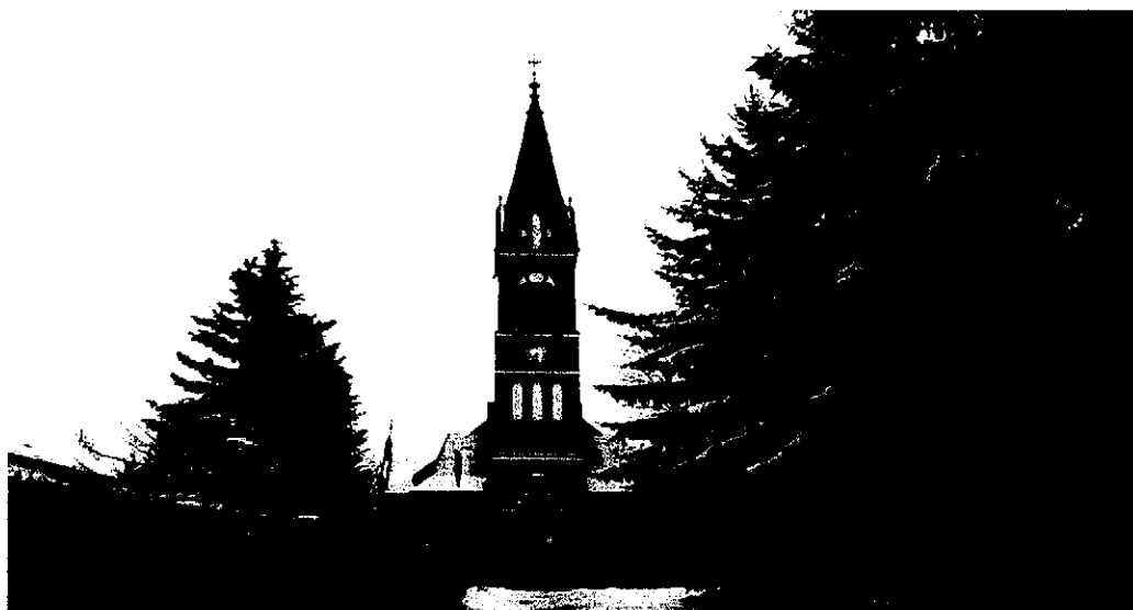
Zdjęcie: Kościół p.w. św. Stanisława Kostki w Karolewie